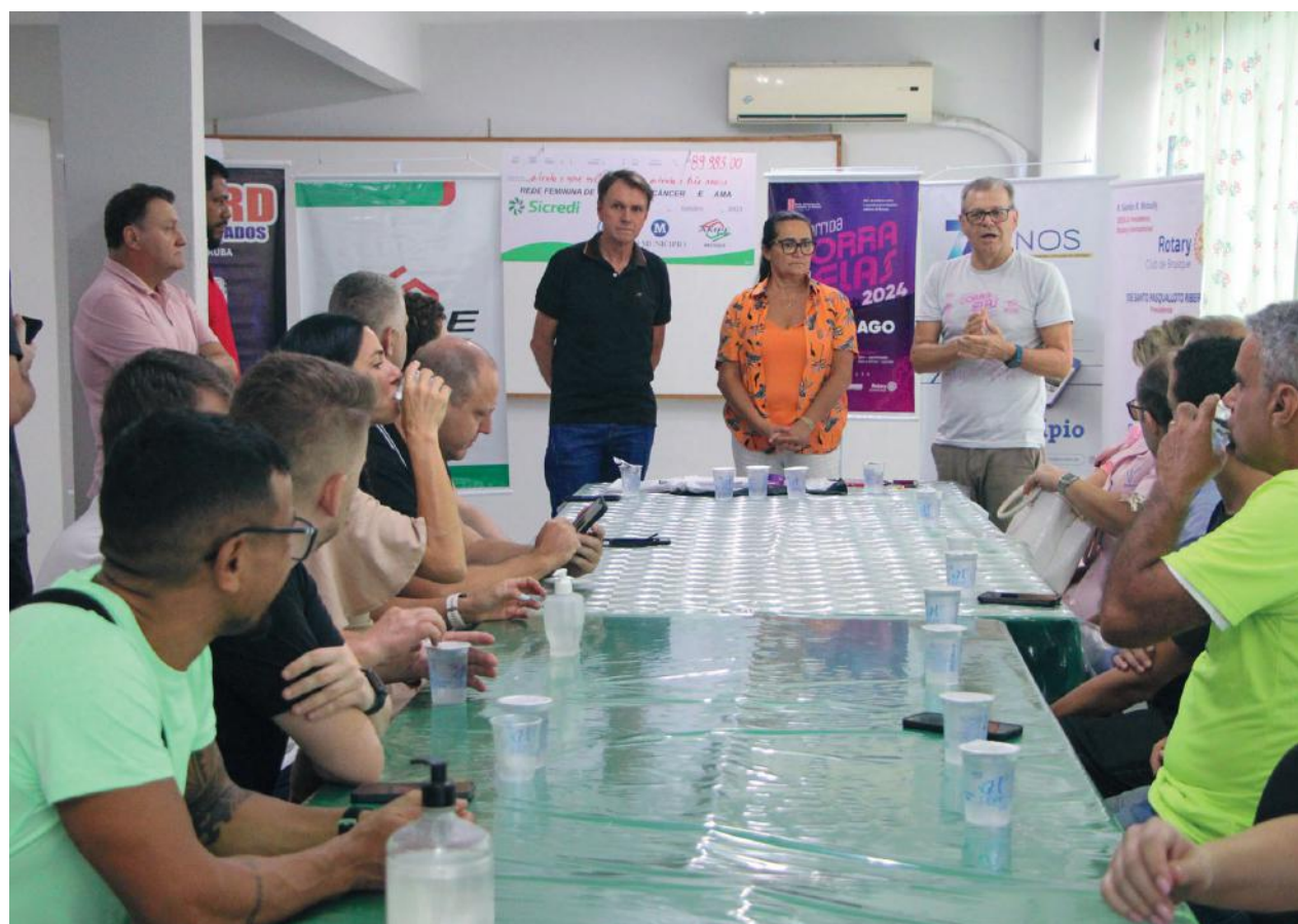
A 4ª Corra Por Elas acontece no dia 18 de agosto em Brusque, já está com inscrições abertas e terá toda sua renda revertida em prol da Rede Feminina de Combate ao Câncer de Brusque