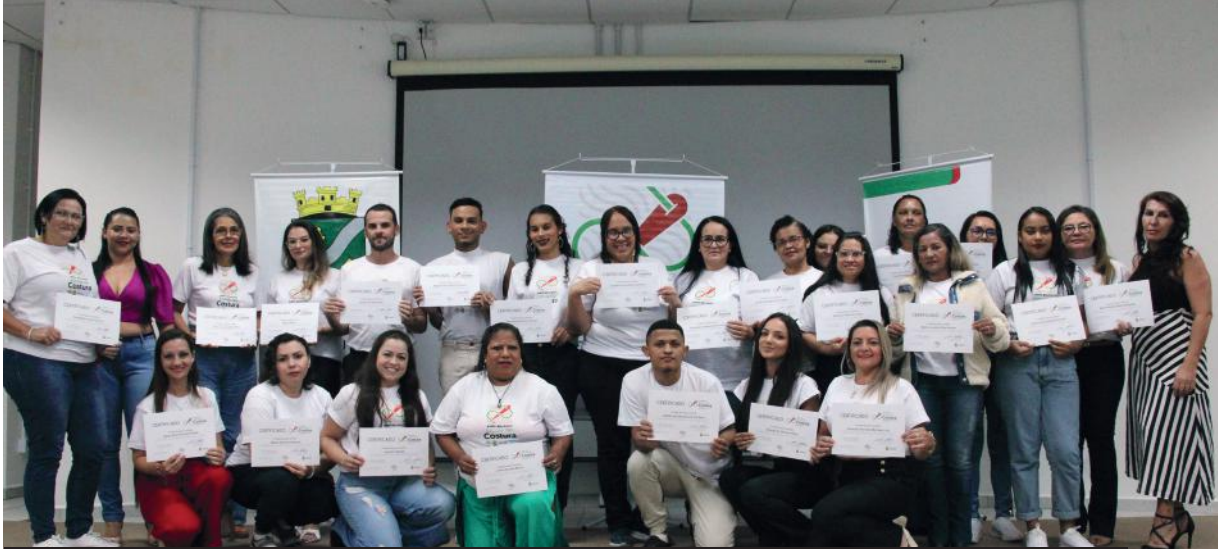
Com mais uma turma de profissionais formadas, a Escola de Costura da AmpeBr, em parceria com a prefeitura, já formou quase mil costureiros e costureiras para o mercado de trabalho

Desde sua primeira edição, projeto desenvolvido pela AmpeBr, em parceria com a Prefeitura Municipal, já capacitou quase 1.000 pessoas