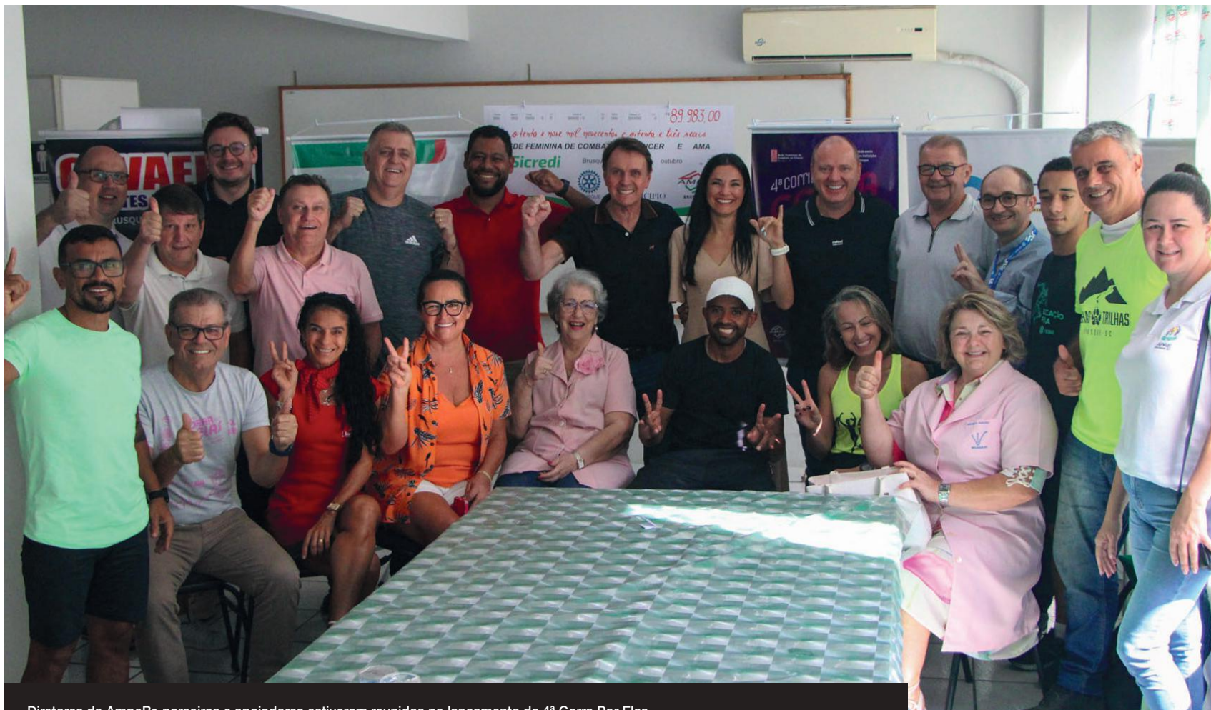
Diretores da AmpeBr, parceiros e apoiadores estiveram reunidos no lançamento da 4ª Corra Por Elas

Corrida solidária será no dia 18 de agosto e terá todo valor revertido para a Rede Feminina de Combate ao Câncer