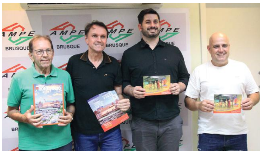
No encontro, a entidade firmou com a Prefeitura a reserva do Pavilhão da Fenarreco para realização das edições da rodada no ano de 2025